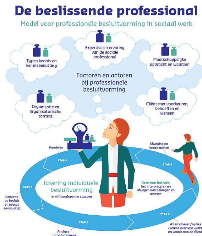
Afbeelding 2: De beslissende professional

In dit actieonderzoek hebben we behalve naar de rol van het team bij de pedagogische civil society, ook gekeken hoe de wijze waarop het team besluiten neemt versterkt kan worden. Professionele besluitvorming definieerden we in eerder onderzoek als: ‘de wijze waarop sociaal professionals hun handelen inrichten, de keuzes die ze daarbij maken en hoe die keuzes tot stand komen’ (Spierts et al., 2017a, p. 14). Op basis van dit eerdere onderzoek is een model van professionele besluitvorming ontwikkeld (zie afbeelding 2).